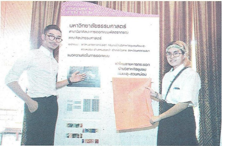
"ผ้าไหมลายทางกระรอก" ศุกลักษณ์ - กมลชนก

เพื่อนำเสนอธรรมชาติและ ความอุดมสมบูรณ์ของผืนป่าได้อย่างสมจริงมากที่สุด