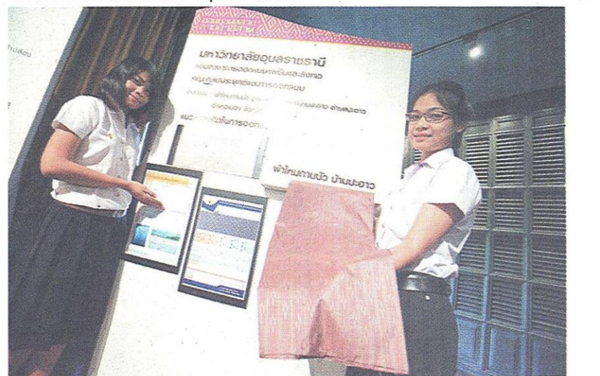
"ผ้าไหมกาบบัว" อทิตยา - สุภาภรณ์